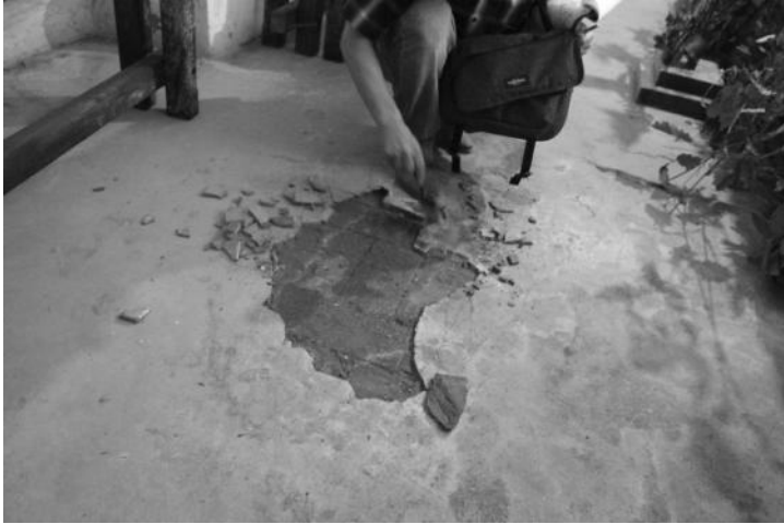
Бетонная сцяжка на цаглянай падлозе крытты.