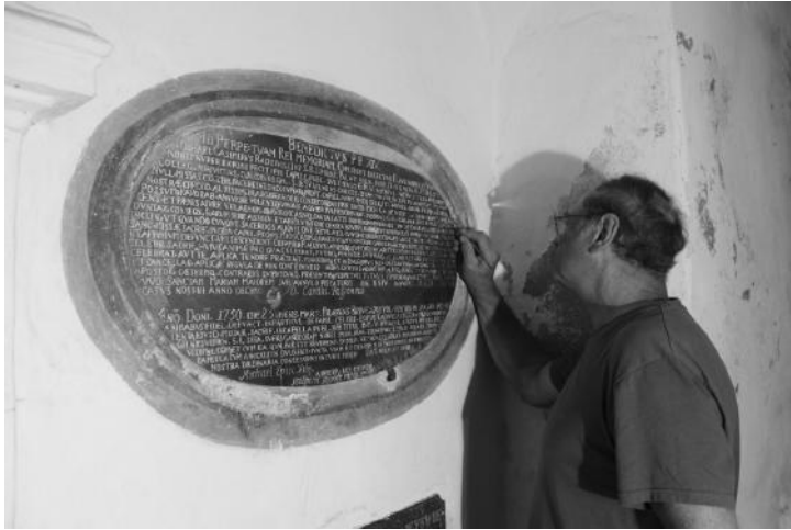
Кестуіс Норкунас ажыціяўляе апрацоўку шылды пры ўваходзе ў крыпту.

Зандаж насценнага роспісу, праведзены Індрай Валкунене, паказаў, што яго неаднойчы перапісвалі. Верхні слой, які сёння бачаць наведвальнікі, гэта роспіс, зроблены ў 1905 г. па ініцыятыве Радзівілаў. Пад ім знаходзяцца слаі XIX і XVIII стст., а яшчэ глыбей – самы ранні роспіс часоў Мікалая Крыштафа Радзівіла Сіроткі. Але без дадатковага вывучэння немагчыма сказаць, наколькі поўна ён захавася. Усе слаі роспісу адрозніваюцца колеравай гамай. Роспіс XX ст. вызначаецца кантрастным чорным контурам, для жывапісу XIX ст. ўласцівыя охрыстыя і чырвоныя адценні. Ружовыя і бэзавыя колеры – прыкмета роспісу XVIII ст.