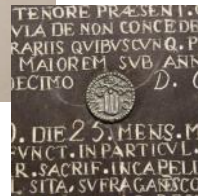
Мемарыяльная шылда пры ўваходзе ў крыпту да рэстаўрацыі (уверсе). Шылда пасля кансервацыі і адноўленага пячатка Папы Рымскага Бенедыкта XIV (унiзе)