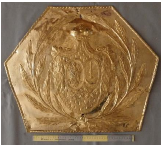
Гербавы картуш з саркафага Канстанцыі Радзівіл-Чудоўскай да рэстаўрацыі (уверсе) і пасля рэстаўрацыі (унізе).