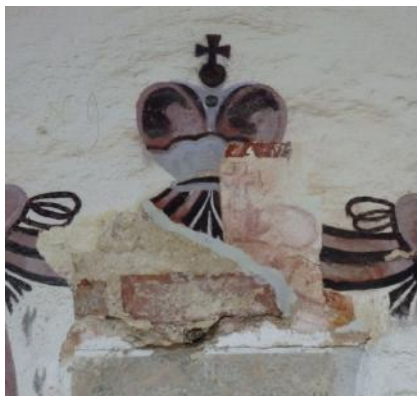
Фрагменты роспісу на сценах крыпты.