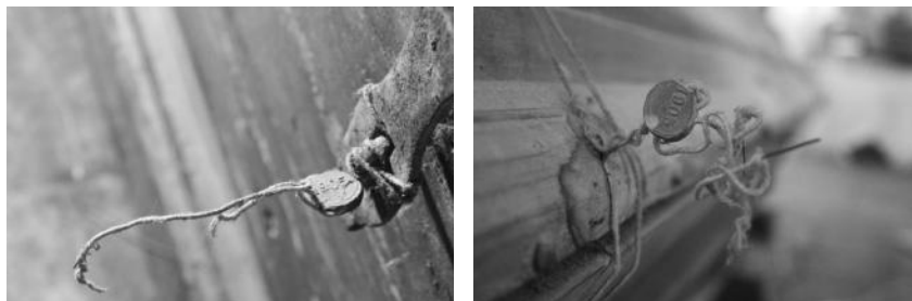
Свінцовыя пломбы 1905 г. на радзівілаўскіх саркафагах.

Каб захаваць унікальны маўзалеі і стварыць належныя ўмовы для яго наведвання, неабходна правесці комплексныя даследаванні, на падставе якіх распрацаваць праграму па кансервацыі-рэстаўрацыі. Для ажыццяўлення гэтай мэты быў падрыхтаваны сумесны літоўска-беларускі праект «Даследаванні і канцэпцыя прыстасавання да наведвання пахавальні княжацкага роду Радзівілаў у крыпце нясвіжскага касцёла». Кіраўніком праекта з літоўскага боку стала Аўдроне Вішняўскене – галоўны дзяржаўны інспектар Дэпартамента па культурнай спадчыне пры Міністэрстве культуры Літоўскай рэспублікі. Яна працавала ў крыпце яшчэ ў 1999 г., калі праводзілася інвентарызацыя маўзалея. З беларускага боку работу каардынаваў Сяргей Клімаў – дырэктар Нацыянальнага гісторыка-культурнага музея-запаведніка «Нясвіж». Праграма дзеянняў была ўзгодненая з навуковым кіраўніком рэстаўрацыі касцёла, галоўным архітэктарам ТАА «Белрэстаўрацыя» Андрэем Карпуком.